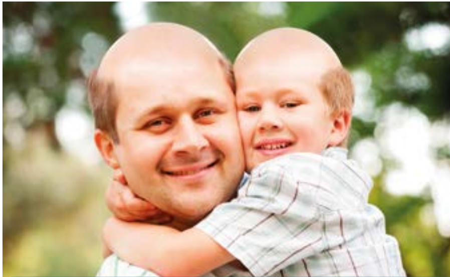
Eine Falschannahme auf humorvolle Art: Haarausfall muss keine Erblast sein!

Kopf ausfallen, ist das ein Zeichen dafür, dass der Körper die Kopfhaut zur Unterstützung der Entgiftung beansprucht.